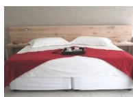
Villa Vista Guest House