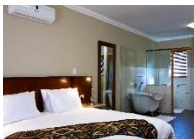
Fig Tree Guest House

Diplomat Hydro Spa and Wellness Centre www.diplomathydro.com