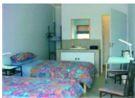
Hotel Pension Cori