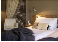
Village Courtyard Suites