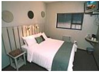
Auas City Lodge