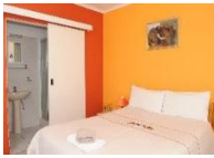
Hotel Pension Umland