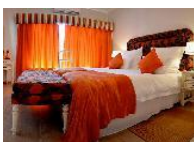
Villa Moringa Guesthouse