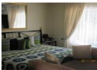
Pension New Nouveau