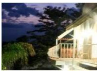
Rosahoff Guest House