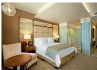
Hilton Hotel Windhoek