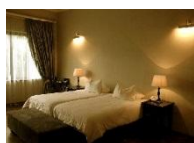
Villa Verdi Guesthouse