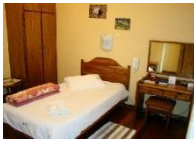
Hotel Pension Eros