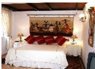
Casa Blanca Boutique Hotel