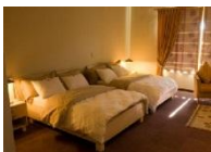
Hotel Pension Thule