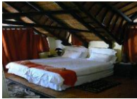
Sand Rose Guesthouse