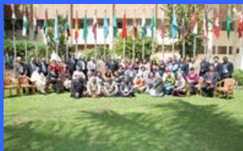
Le Caire, Égypte