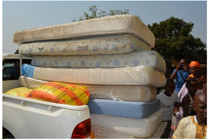
Un lot de matériel et de vivres pour les orphelins d'Ebola

l'épidémie de concentrer aussi les efforts dans la prise en charge de ces orphelins.