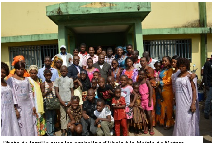
Photo de famille avec les orphelins d'Ebola à la Mairie de Matam

La remise de ce don constitué de lits, de matelas, de vêtements, de nourriture, d'ustensiles de cuisine et de jouets s'est faite en présence du Chef de Cabinet du Ministère de l'Action Sociale de la Condition Féminine et de l'Enfance, de la Directrice Nationale de la Condition Féminine, du Directeur communal de la jeunesse de Matam (une des cinq communes de Conakry), des représentants de l'Organisation Mondiale de la Santé (OMS), du Haut Commissariat des Droits de l'Homme (HCDH), de l'Organisation des Nations Unies pour la Population (UNFPA), de la Présidente de l'ONG FELFEDEF et de la Présidente de la FUNSA.