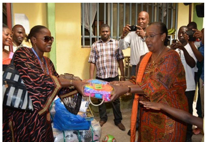
De G à D : la Présidente du FUNSA et la Direction Nle Action sociale

La cérémonie a été marquée par la présentation d'un sketch dont le contenu et les différents rôles interprétés par ces orphelins retracent la vie de chacun d'eux. Un moment chargé d'émotion et riche en témoignages.