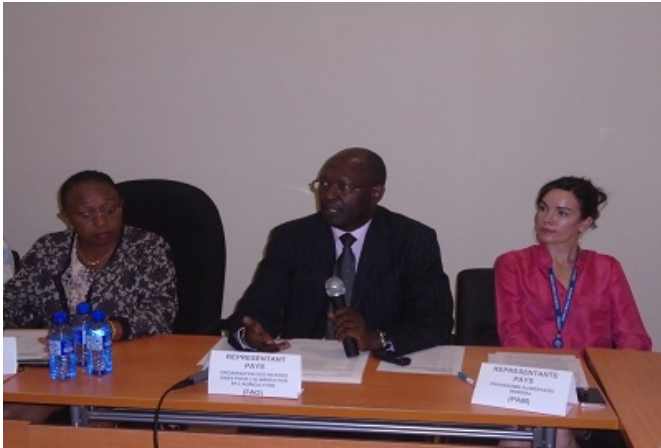
De G à D: la Ministre de l'Agriculture, le FAOR et la Rep du PAM

Le Ministère de l'Agriculture, l'Organisation des Nations Unies pour l'Alimentation et l'Agriculture (FAO) et le Programme Alimentaire Mondial (PAM) ont présenté le 18 décembre 2014 les résultats de l'évaluation rapide de l'impact de la maladie à Virus Ebola (MVE) sur l'agriculture et la sécurité alimentaire.