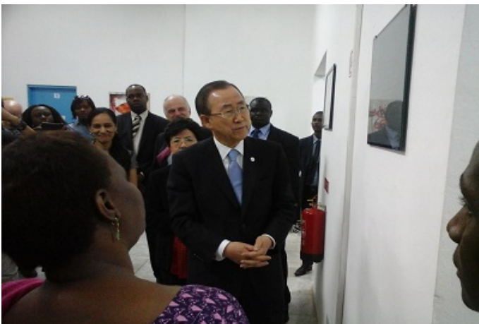
Le SG entouré du personnel du SNU en Guinée au siège de l'UNMEER

De Sékhoutouréya, le Secrétaire général des Nations unies et le chef de l'Etat ont visité le centre de traitement des soignants du virus Ebola, avant de se rendre au Mali.