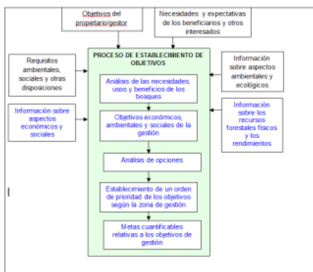
Gráfico 1. Proceso de establecimiento de los objetivos de gestión para la unidad forestal de gestión

La gestión de los bosques con miras a fomentar varios productos y servicios (es decir, “gestión multipropósito”) puede incrementar el valor monetario que las comunidades, los gestores y los propietarios (que a veces son la misma persona) obtienen del recurso forestal. Por ejemplo, cada vez se recurre más a la producción y la recolección de PFM para compensar los costos del aprovechamiento maderero de bajo impacto (como en algunas concesiones madereras otorgadas en Malasia y el Camerún).