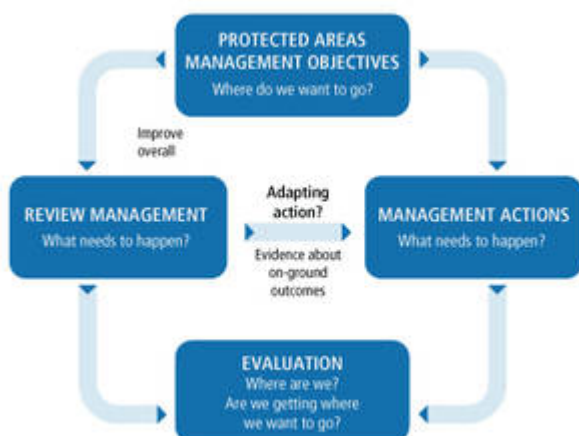
Figure 2. Processus de planification de gestion participative, rationnelle et adaptative (Spoelder, P. et al., 2015)

L'élaboration d'un plan de gestion d'une aire protégée comporte généralement quatre étapes, qui s'inscrivent dans un processus de planification participative, rationnelle et adaptative.