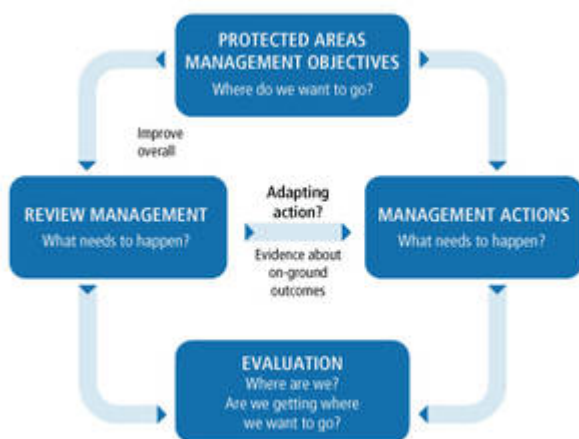
Figure 2. Processus de planification de gestion participative, rationnelle et adaptative (Spoelder, P. et al., 2015)

L'élaboration d'un plan de gestion d'une aire protégée comporte généralement quatre étapes, qui s'inscrivent dans un processus de planification participative, rationnelle et adaptative.