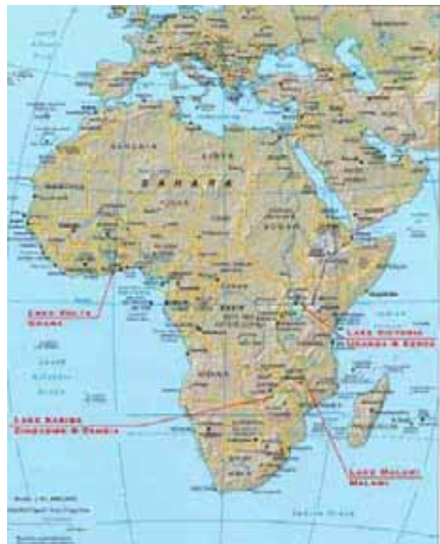
Sites aquacoles en cage en Afrique

Dans la région, les tilapias sont les seuls poissons qui ont fait l'objet d'un élevage en cage (principalement les tilapias du Nil [ Oreochromis niloticus ] et les «chambo» [ O. shiranus et O. karongae ]). Deux ou trois petites expériences – dont nous ne parlerons pas dans cette étude étant