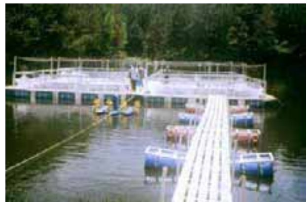
Cages expérimentales au Kenya, années 80

Plusieurs institutions gouvernementales sont associées à la recherche et à la formation propres au domaine aquacole: la Direction des pêches (DoF), l'Université des sciences et technologie de Kwame Nkrumah, l'Université du Ghana, l'Université de Cape Coast et l'Institut technique agricole de Kwadaso. Des experts-conseils sont sollicités à temps partiel pour la formation des cadres et des ouvriers dans le domaine de l'exploitation des fermes aquacoles.