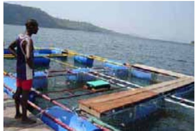
Tropo Farms: cages sur le lac Volta, Ghana

La contrainte la plus importante relative à l'élevage en cage commercial au Ghana est celle d'obtenir des aliments de qualité supérieure qui soient fabriqués au niveau local. Aucun aliment extrudé issu de production locale n'est disponible. Tropo fabrique sur place ses propres aliments sédimentés semi-humides et cherche à développer une production