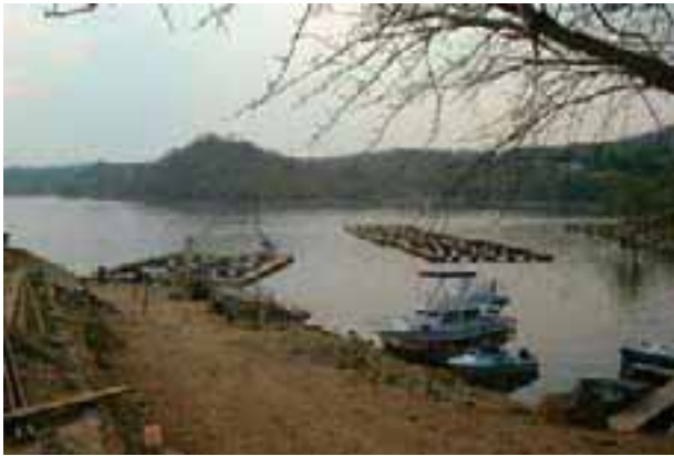
Cages en bois sur le lac Kariba, Zambie

d'entre elles ne produit plus de 10 tonnes par an de poissons entiers. Toutes élèvent les Oreochromis niloticus et produisent leurs propres alevins et juvéniles 4 .