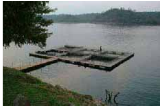
Une des trois fermes d'élevage en cage sur le lac Kariba, Zambie

L'aquaculture est placée sous le contrôle de la Direction des pêches – Département de l'aquaculture. En Ouganda, les exportations liées à la pêche constituent la source la plus importante de devises étrangères. Les captures sauvages ont atteint leur production maximum et l'aquaculture est très fortement encouragée pour, d'une part, des raisons de sécurité alimentaire, et pour, d'autre part, augmenter les volumes de production et assurer de futures recettes à l'exportation. L'autorité compétente responsable chargée de gérer les questions de qualité du poisson à l'exportation est la Direction des pêches.