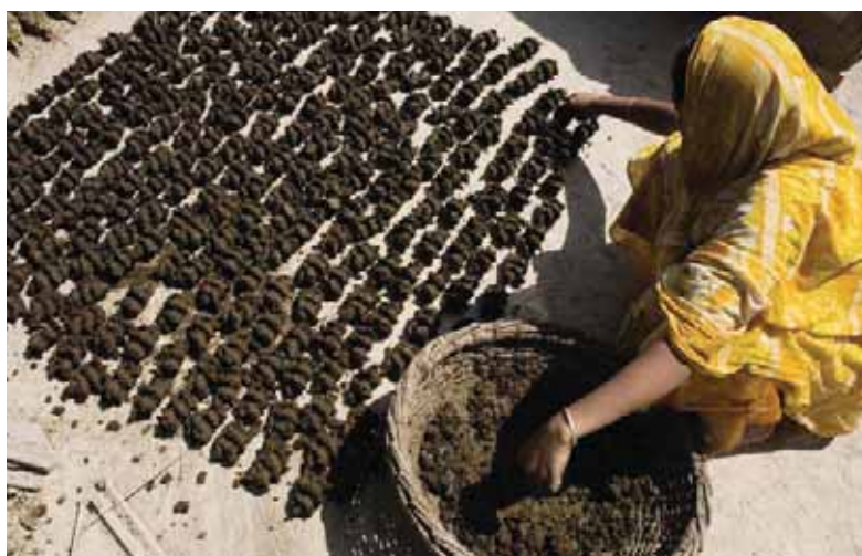
Producción de biocombustible con estiércol de vaca en Bangladesh.

emisiones derivadas de la deforestación y degradación de los bosques (REDD). No obstante, ofrecemos una pequeña introducción a los MDL porque existen algunas posibilidades para proyectos a pequeña escala (p. ej., sobre energías renovables). Además, muchas de las reglas establecidas (véase Recuadro 3) valen también para el mercado voluntario.