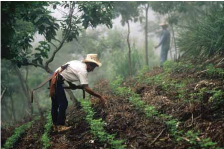
Control de la erosión del suelo a través del cultivo de plantas, Foto de ©FAO/Giuseppe Bizzarri.

Pueden encontrarse otros ejemplos de proyectos de carbono basados en la tierra en el Inventario del Forest Carbon Portal: www.forestcarbonportal.com .