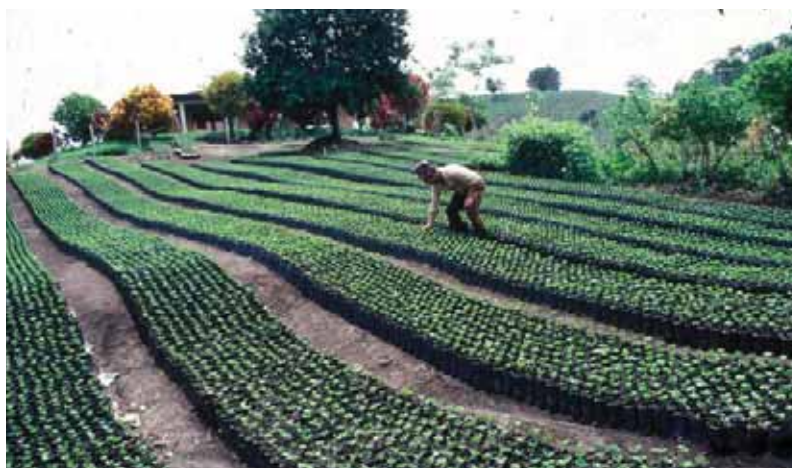
Reciclaje de residuos orgánicos de la producción de café en Colombia.