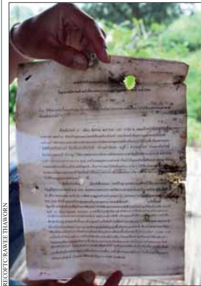
Documento que declara el arresto de un aldeano, la confiscación de su tierra y el adeudo de una multa de 5 000 baht (150 USD) por el cultivo ilícito de la tierra, invocándose la Ley nacional de parques de 1961 como motivación de las sanciones impuestas

aldeanos fueron detenidos porque todavía cultivaban las tierras disputadas.