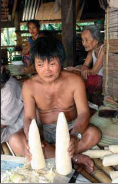
RECOPILADO DE THAWORN

Tras un acuerdo con los oficiales del parque nacional firmado durante el proceso de mediación en vista de la resolución del conflicto, los aldeanos de Teen Tok pueden nuevamente cosechar bambú en el bosque