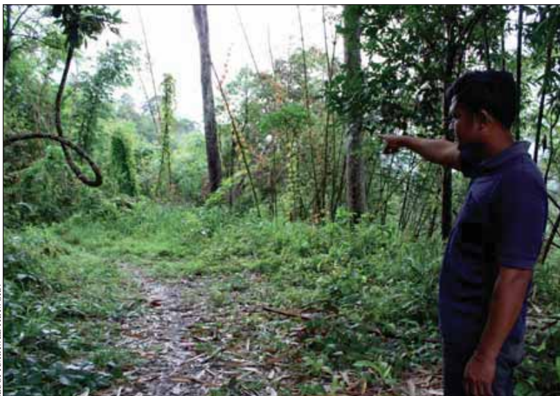
Un aldeano de Teen Tok indica la parcela de bosque que la comunidad espera convertir en un bosque comunitario oficial gracias al apoyo de los funcionarios locales y la legislación nacional