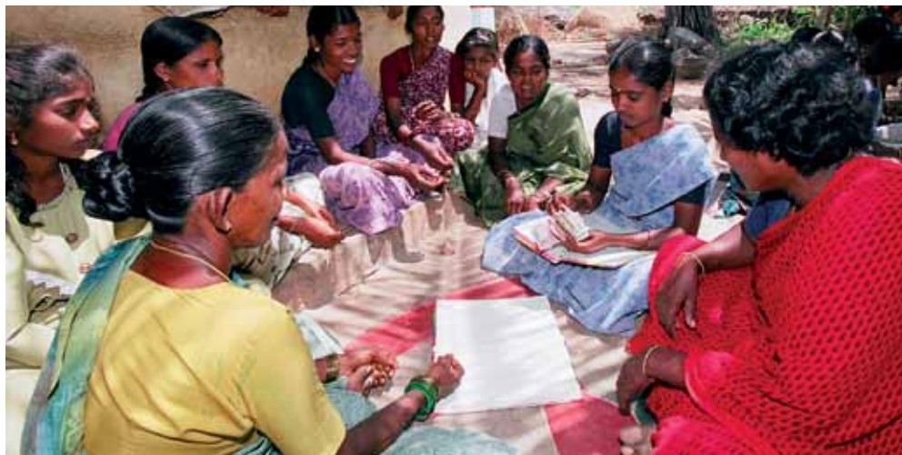
Coopérative agricole en Inde