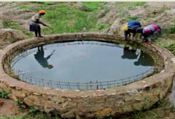
Embalse usado en Rwanda para regar cultivos