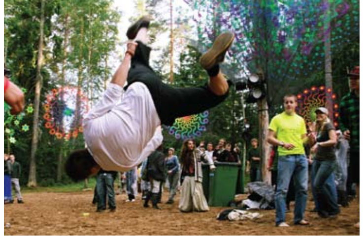
En Finlande, le festival forestier annuel en plein air connu comme «Konemetsä» encourage un mode de vie fait de paix, amour, unité et respect.