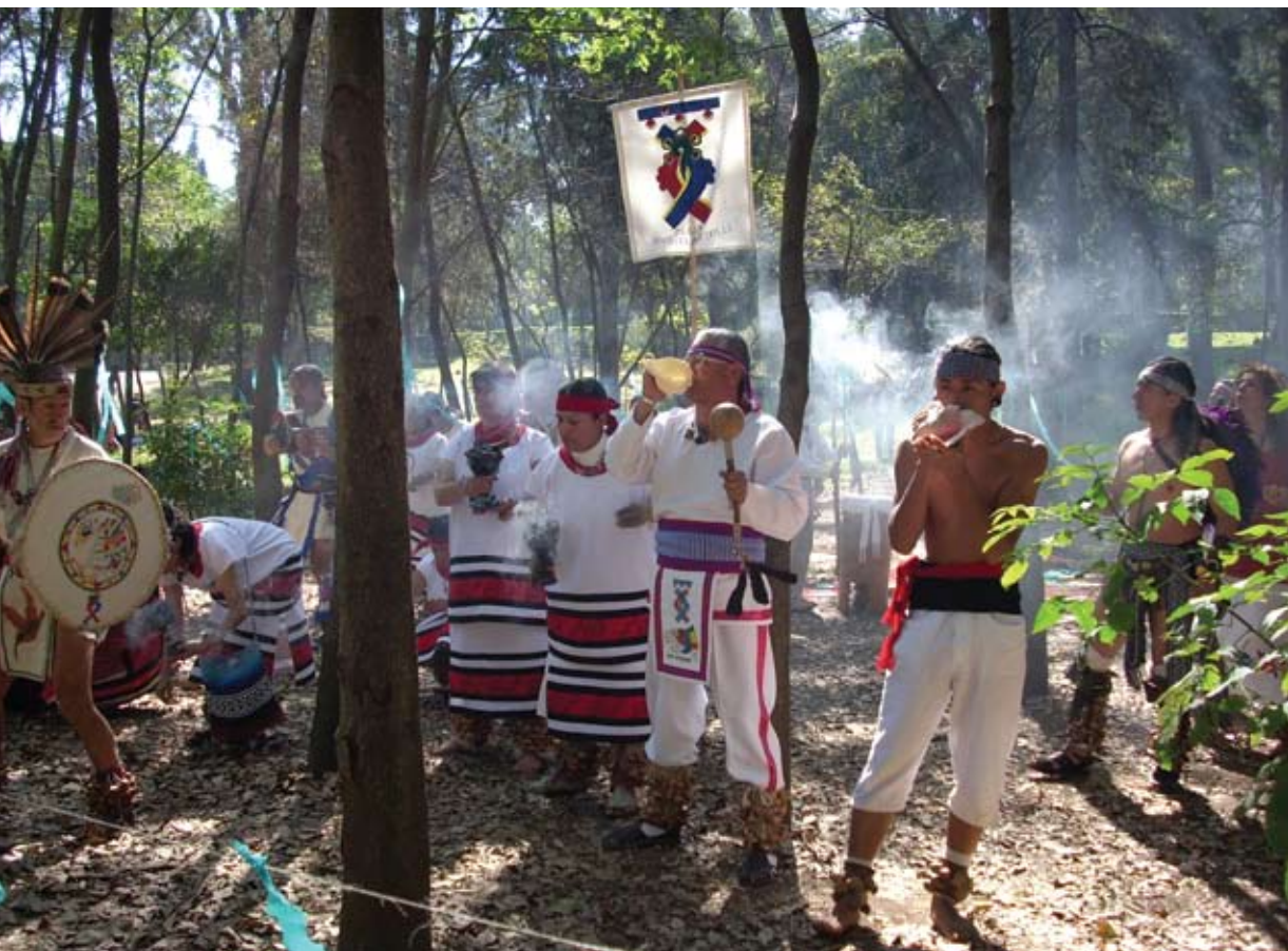
Le Parque Nacional Bosque de Pedregal, une forêt urbaine de Mexico, a son propre centre culturel, la Casa de Cultura, qui promeut parmi ses activités des ateliers pour la danse et d'autres arts.