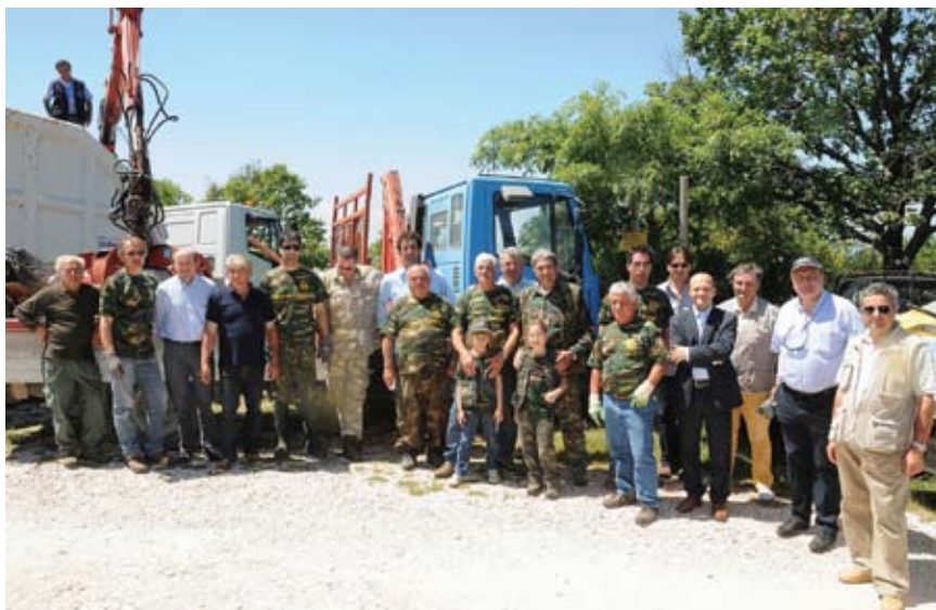
Para festejar el Día de la Ecología, que se celebra bajo los auspicios de una asociación cinegética local, estos voluntarios de la región italiana de Umbría limpiaron un bosque de montaña. Recolectaron más de una tonelada de basura, entre la que había electrodomésticos viejos, colchones y neumáticos abandonados en los bordes de carreteras, y restauraron la belleza paisajística del bosque.