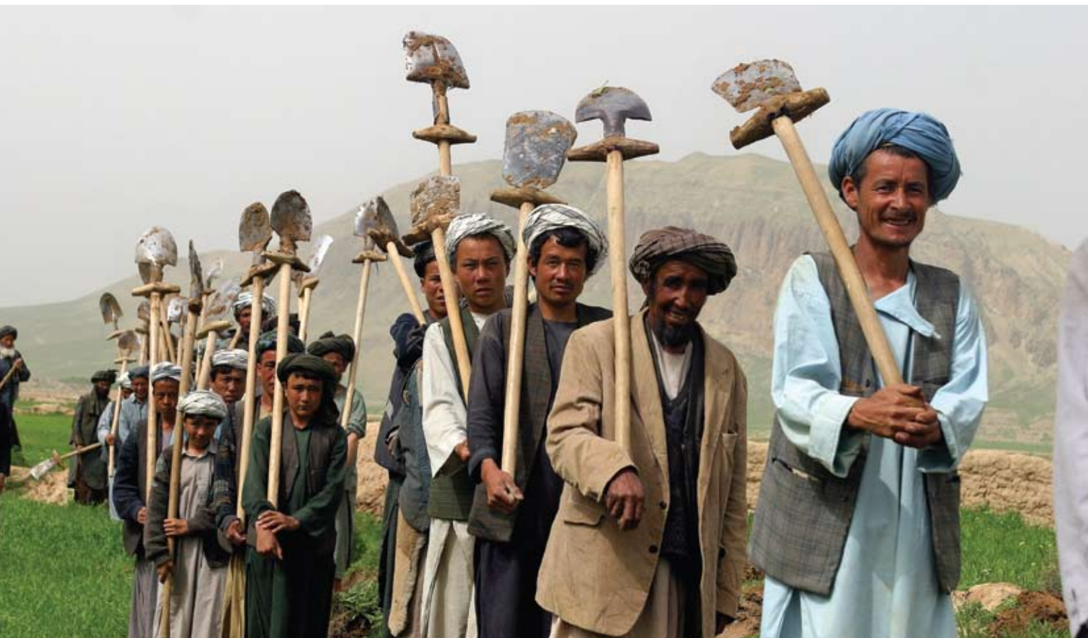
Los participantes en un programa de alimentos por trabajo patrocinado por el Programa Mundial de Alimentos (PMA) de las Naciones Unidas en Afganistán plantaron más de 80 000 árboles durante el primer semestre de 2007, y construyeron o repararon además caminos y canales.