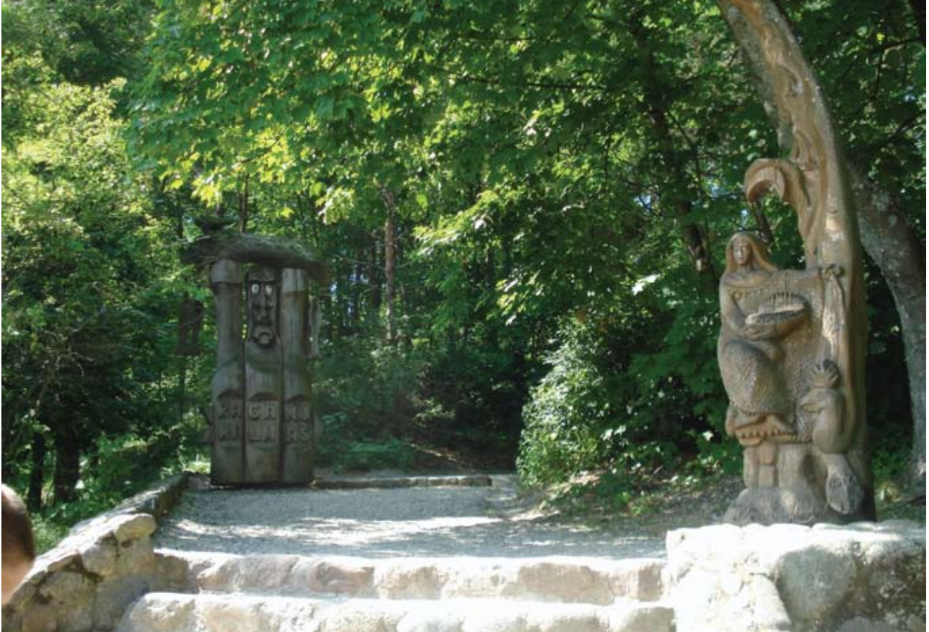
La Colina de las Brujas, situada cerca de Juodkrantė (Lituania), es una galería de esculturas al aire libre que se encuentra en una duna de arena arbolada. La galería fue creada en 1979 y contiene ahora unas 80 esculturas dispuestas a lo largo de una serie de sendas. Los artistas talladores basaron sus obras en la larga tradición de la talla de la madera que caracteriza a la región y en la no menos prolongada tradición de celebraciones de la víspera de la noche de San Juan que se llevan a cabo en la colina. Las estatuas representan a personajes del folclore lituano y de las tradiciones paganas. THOMAS PUSCH