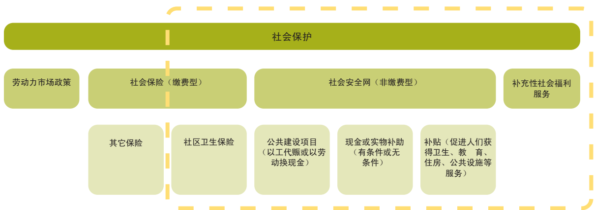
柬埔寨政府的社会保护国家战略