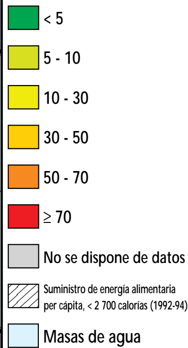
Dependencia respecto de las importaciones de alimentos, promedio anual 1988-90 (%)