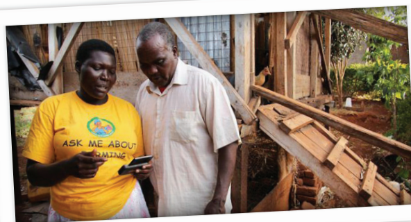
Grameen Foundation - Ouganda

En Ouganda, la Fondation Grameen a mis en place un système dans lequel 800 travailleurs du savoir communautaire ( Community Knowledge Workers - CKWs ) utilisent des téléphones mobiles pour fournir aux agriculteurs pauvres des informations en temps réel sur des sujets agricoles, notamment les prix du marché, et sont aidés par un centre d'appels dans lequel travaillent des experts agricoles hautement qualifiés, qui parlent les principales langues de l'Ouganda. Les CKWs documentent également les pratiques agricoles traditionnelles et les partagent via TECA (« technologies and practices for agricultural producers »), une plateforme en ligne qui facilite l'accès à l'information, accessible aux petits producteurs partout dans le monde.