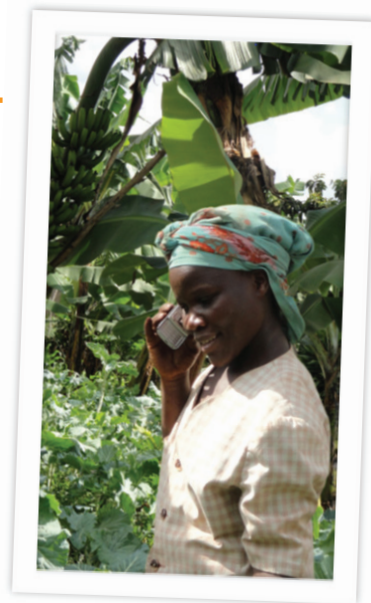
Grameen Foundation - Ouganda

Durant la discussion, les participants ont parlé des services qui font appel au TIC mis en œuvre par le secteur public, le secteur privé et dans le cadre de partenariats. Les avantages et difficultés des différents modèles ont été examinés, quelques conclusions sur ce qui était le plus approprié ont été tirées. Identifier et renforcer les structures existantes, telles que les systèmes publics de vulgarisation, semblent être essentiels pour la conception d'un modèle durable. Cependant, certains estiment que seul un modèle commercial mis en place par le secteur privé peut se révéler durable.