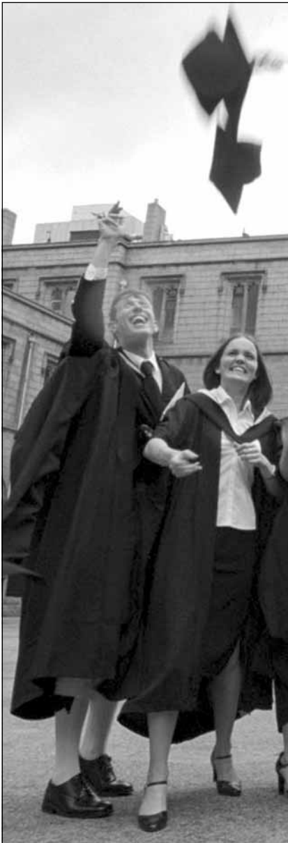
Diplomados de la Universidad de Aberdeen (Reino Unido).

Los resultados de una encuesta realizada en dos países europeos indican un descenso del número de estudiantes que deciden emprender estudios forestales, lo cual puede tener consecuencias importantes para la viabilidad y calidad futuras de la enseñanza forestal profesional.