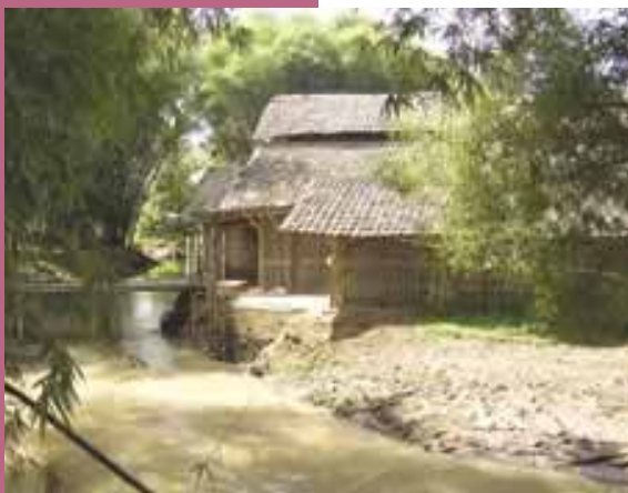
小型商业蛋禽养殖场， 印度尼西亚西爪哇