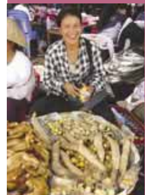
家禽市场，老挝 人民民主共和国