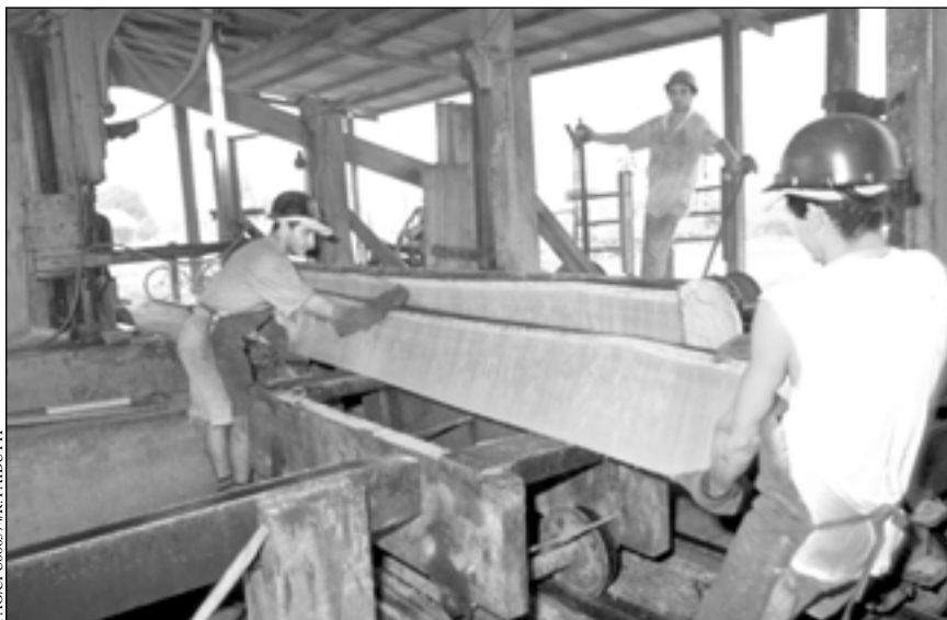
El empleo en el sector forestal es sumamente importante para la subsistencia de millones de personas; se estima que 12,9 millones, como estos trabajadores en el Brasil, encuentran empleo en el sector forestal industrial

Los bosques tienen el potencial para ayudar a las poblaciones a salir de la pobreza, por ejemplo al asegurar el empleo basado en los bosques y permitir el desa-