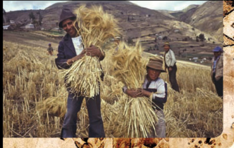
FAO 15663 J. Bravo