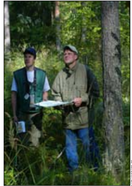
Les conseils individuels et les visites sur les lieux font partie intégrante des activités d'une association de gestion forestière: un propriétaire forestier et un conseiller d'une association de gestion forestière comparent les mesures proposées dans le plan d'aménagement avec la situation réelle de la forêt

La fourniture volontaire de conseils sylvicoles et la coopération entre les propriétaires forestiers privés en Finlande repose sur une longue histoire et tradition. Les premières associations de ges-