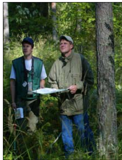
La orientación individual y las visitas de campo forman parte integrante de las actividades de la Asociación de Ordenación Forestal: un propietario de bosque y un asesor de la Asociación contrastan las mediciones que se han propuesto en el plan de ordenación forestal con los datos recogidos en el condiciones reales en el bosque

La orientación silvicultural voluntaria y la cooperación entre propietarios de bosques privados tienen una larga historia y tradición en Finlandia. Las primeras Asociaciones de Ordenación Forestal se fundaron ya en 1907, a finales del dominio ruso. Su creación respondió a los mismos motivos que justifican su labor actual: la preocupación por la condición de los bosques y por los