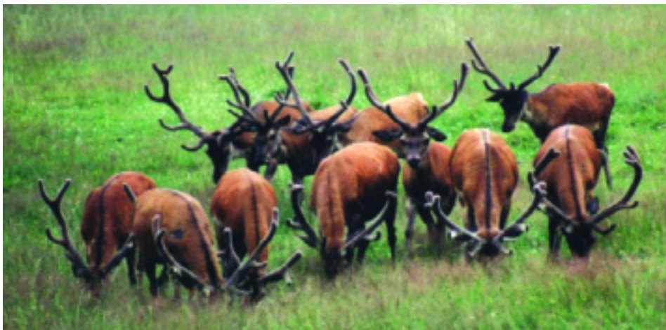
Harde de cerfs d'Europe