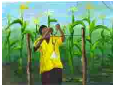
Un fermier en train d'accrocher une clochette à la clôture

Accrocher des clochettes d'alarme sur la clôture autour de votre champs pour vous prévenir de la présence des éléphants. Le bruit des clochettes peut aussi chasser les éléphants.