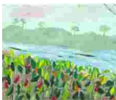
Une nouvelle plantation de piment rouge

Évitez de faire des plantations près des réserves forestières et des limites des parcs nationaux.