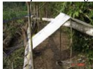
4. Briques de piment-bouse placées au bord d'une plantation