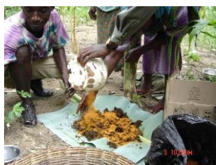
1. Mélanger la poudre de piment et la bouse

Certaines des méthodes que vous pouvez essayer dans votre champ sont à base de piment. Les éléphants n'aiment pas l'odeur du piment et leur peau y est sensible également. La fumée du piment rouge brûlé va loin et les éléphants ne s'approcheront pas de votre plantation si vous brûlez ces briques à base de bouse et de piment dans votre champ. Préparer et brûler les briques de bouse-piment à des endroits précis autour des plantations lorsque la récolte approche !