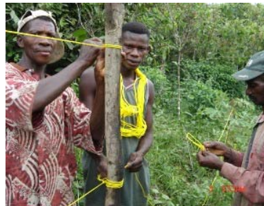
Un groupe de fermiers en train de préparer une clôture

Utilisez une corde pour clôturer votre champ.