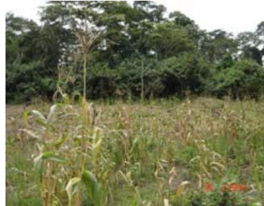
Champ de maïs près d'une réserve forestière

Les paysans créent leurs champs près de la lisière des parcs nationaux.