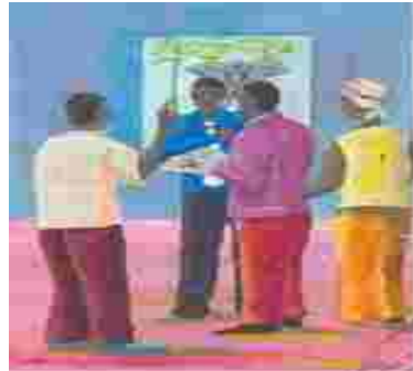
Des fermiers en train de signaler la présence des éléphants au bureau de la faune

Signaler la présence des éléphants dans votre zone au bureau de la faune le plus proche.