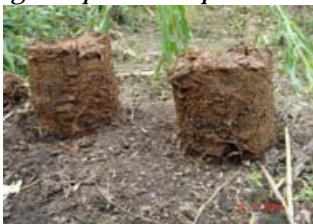
3. Briques de piment-bouse séchées