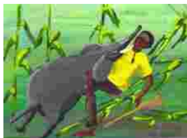
Un chasseur attaqué par un éléphant

Évitez d'abattre les éléphants. Un éléphant blessé peut vous attaquer, vous blesser ou même vous tuer.