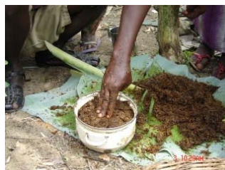
2. Compacter le mélange