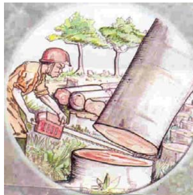
Abattage des arbres dans une réserve forestière

Certaines personnes détruisent l'habitat des éléphants en abattant les arbres dans les réserves forestières ou alors établissent des fermes dans la zone des éléphants. Ce faisant, ils détruisent certains des arbres dont les éléphants se nourrissent et diminuent leur zone de pâturage.