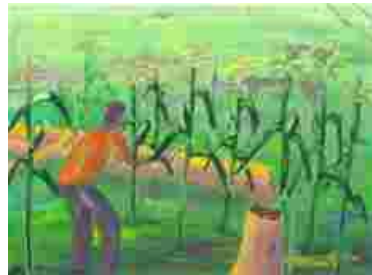
Battement d'écorce d'arbres pour faire du bruit

Utilisez une corde pour clôturer votre champ.