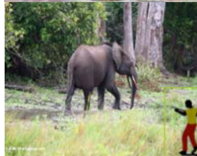
Un chasseur tirant sur un éléphant

Certaines personnes tirent sur les éléphants pour les tuer. Les éléphants ont une bonne mémoire et deviendront agressifs une fois qu'on leur a tiré dessus.