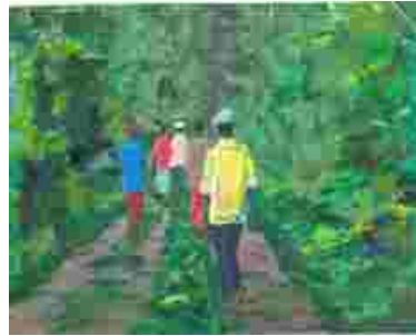
Patrouille de scouts communautaires

Former des scouts communautaires pour aider lors de la préparation des clôtures, garder les plantations et patrouiller les limites des réserves forestières ou des zones de conservation pour chasser les éléphants. Pour toute assistance, consulter le responsable de la faune le plus proche.