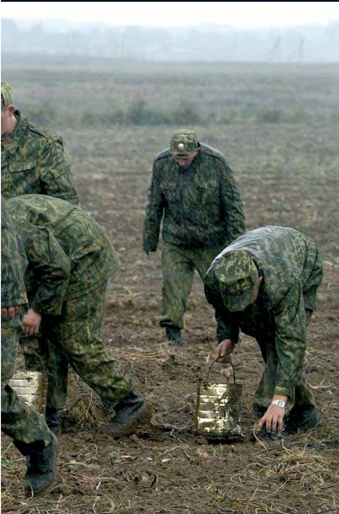
из фотосессии под названием «Белорусские солдаты кушают картофель»