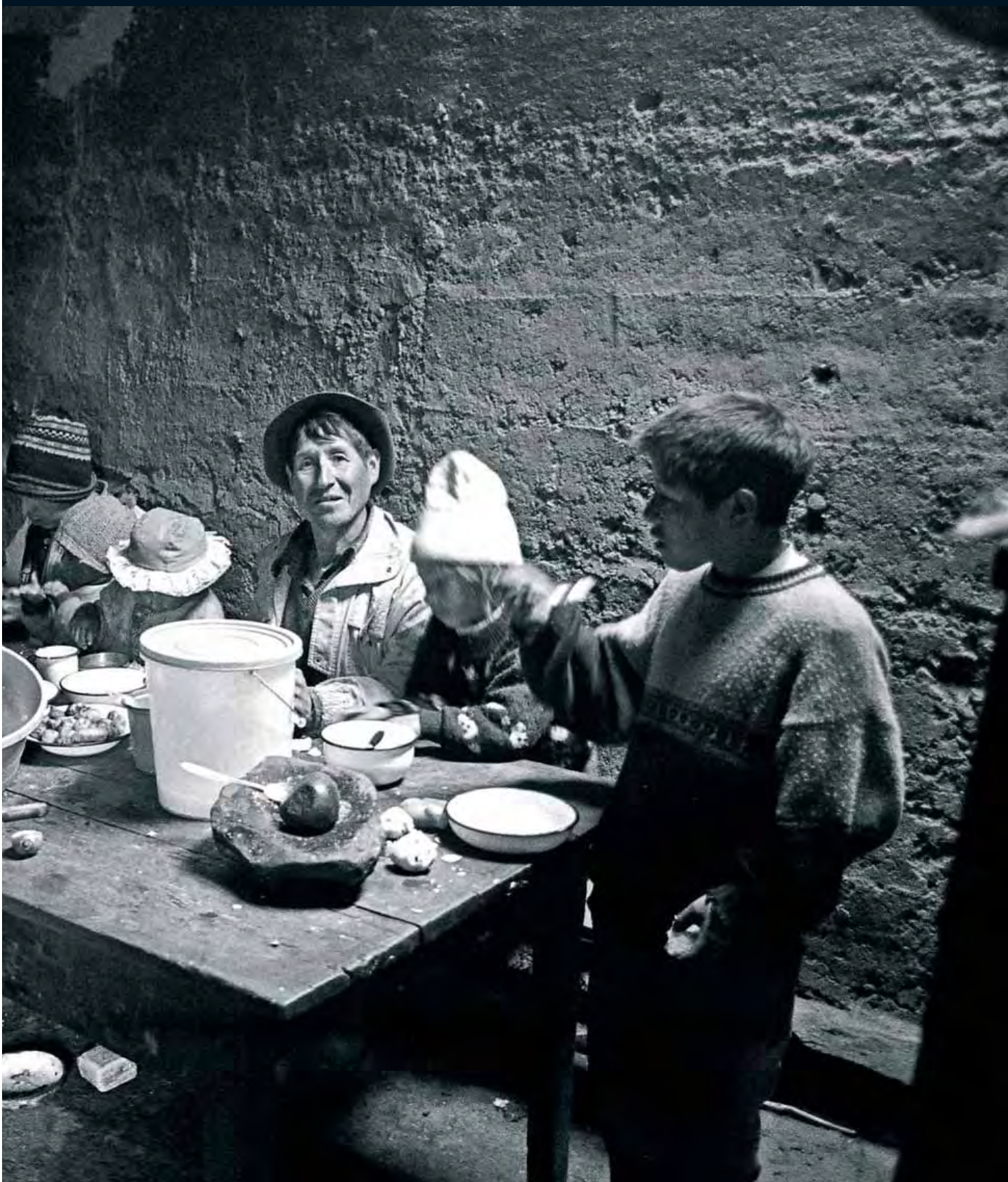
из фотосессии под названием «Хранители биоразнообразия»