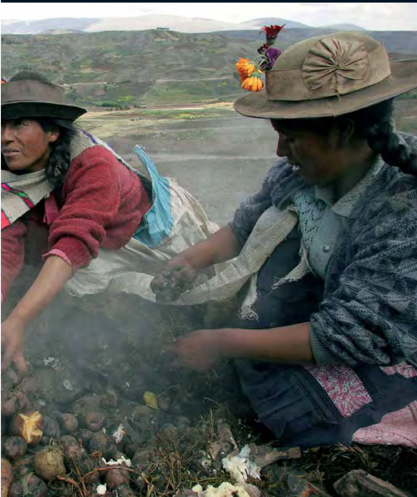
из фотосессии под названием «Урожай родной картошки»