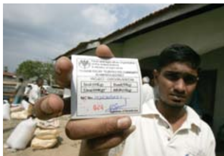
Agricultor damnificado del tsunami en Sri Lanka muestra su credencial para recibir semillas y fertilizante de la FAO.

Dado que la Organización tiene un mandato de desarrollo y la capacidad institucional de pasar sin dificultad de la rehabilitación después de las emergencias a la ayuda para el desarrollo a plazo más largo, las intervenciones de emergencia de la FAO se crean para ayudar a las comunidades a mejorar sus aptitudes y sus explotaciones agrícolas.