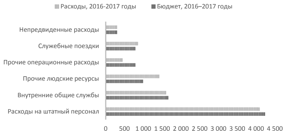
Рисунок 1. Сметные и фактические расходы в 2016–2017 годах по статьям расходов

15. На рисунке 1 приводится сравнение сметных и фактических бюджетных расходов за двухгодичный период 2016–2017 годов по статьям расходов.