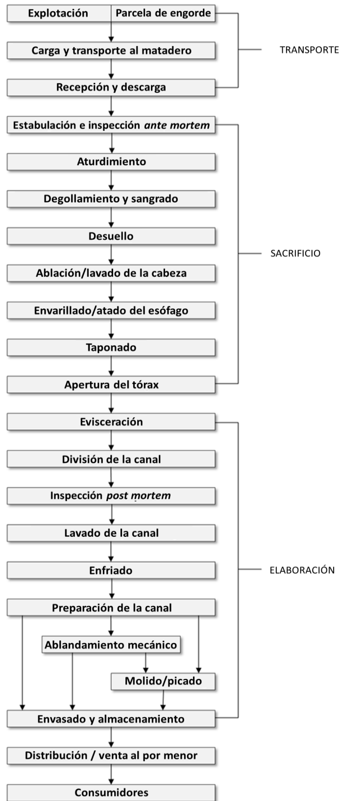
Diagrama 1: Ejemplo de diagrama de flujo de la producción primaria y la elaboración de carne de bovino cruda