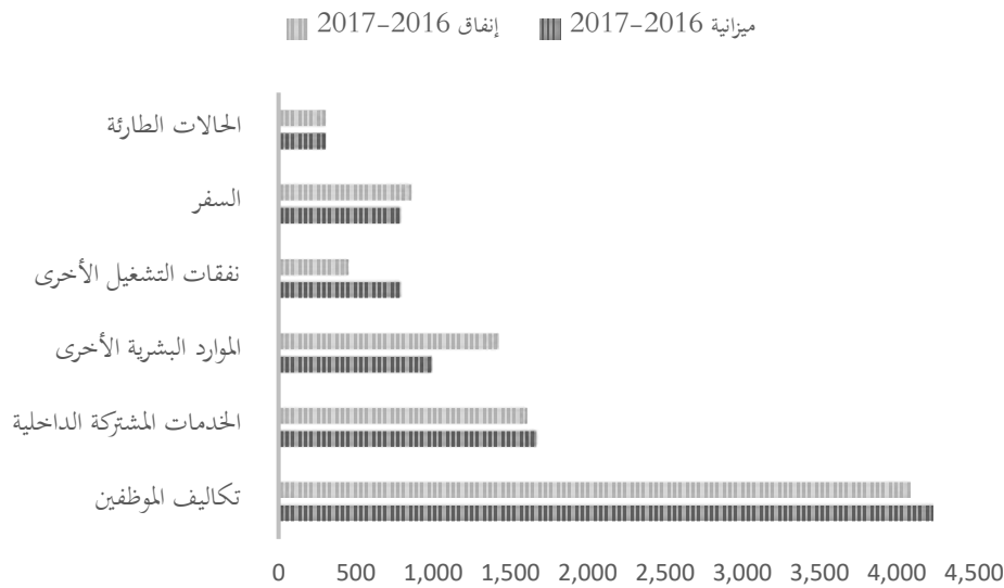
الشكل 1: الميزانية مقابل الإنفاق للفترة 2016-2017 بحسب نوع التكاليف

15- يقارن الشكل 1 إنفاق فترة السنتين 2016-2017 بالميزانية المقررة والمعتمدة وذلك بحسب نوع التكاليف.