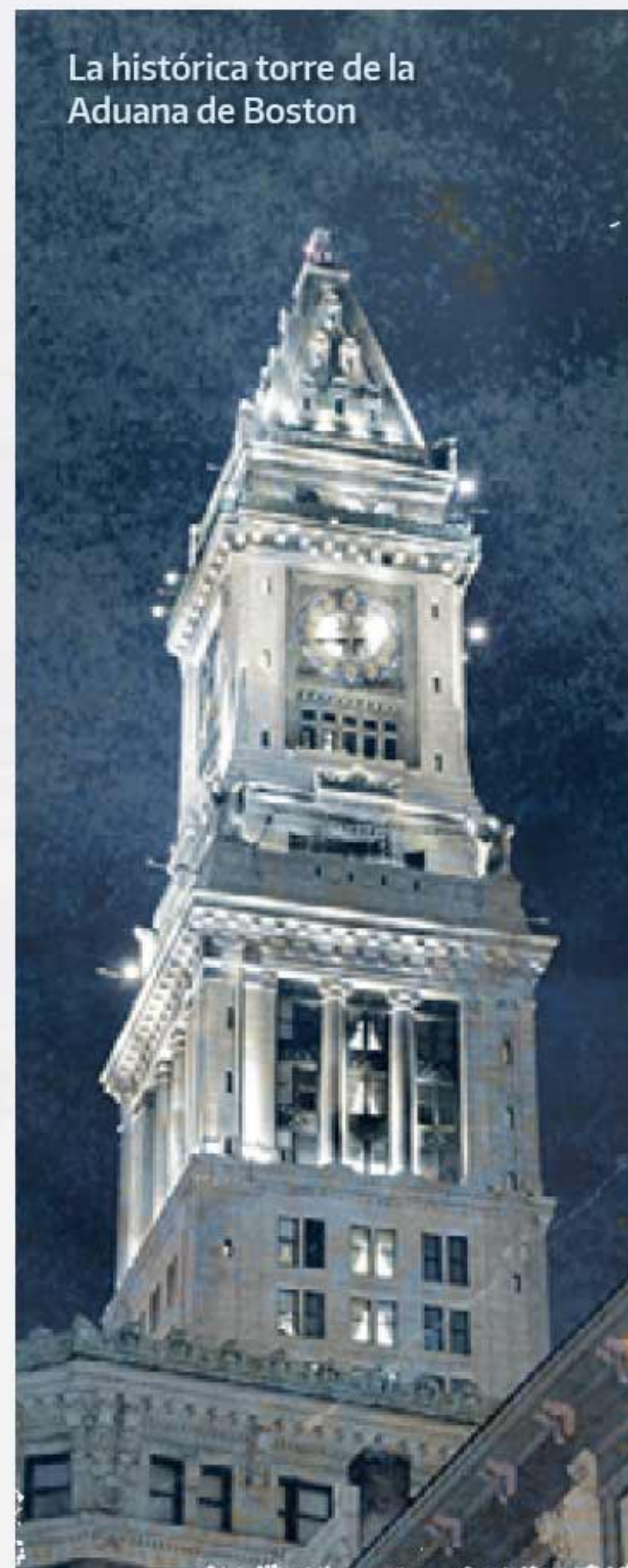
La histórica torre de la Aduana de Boston

La obtención de un visado estadounidense puede ser un largo proceso de varias etapas. Por tanto, se recomienda encarecidamente a los delegados que se informen en la embajada o consulado estadounidense más cercano para determinar si es preciso visado y, en ese caso, los pasos necesarios para su obtención. Aunque la oficina estadounidense del Codex no puede influir en el proceso de obtención de visados, ayudará en lo que pueda, lo que incluye facilitar el justificante de la inscripción. Es responsabilidad de los delegados comenzar el proceso con el tiempo necesario ya que, si no se hace con suficiente antelación a la reunión, puede resultar imposible obtener un visado a tiempo de asistir a la misma.