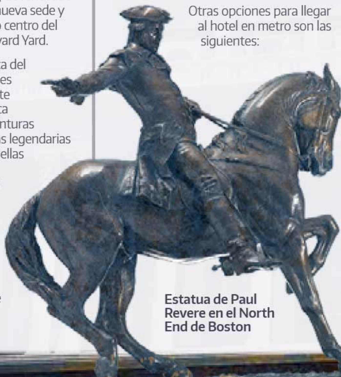
Estatua de Paul Revere en el North End de Boston

Las tarifas son planas, lo que incluye todos los peajes, impuestos y propinas a la persona que conduce. Las tarifas planas se estructuran de la siguiente forma: hora punta (de lunes a viernes): 7:00 - 21:00 y 15:30 - 18:30, 30,00 dólares por taxi (1-4 pasajeros). Para el resto de horarios, que incluyen los días entre semana: 26,25 dólares por taxi (1-4 pasajeros); los monovolúmenes y camionetas son algo más caros; todos los precios pueden cambiar.