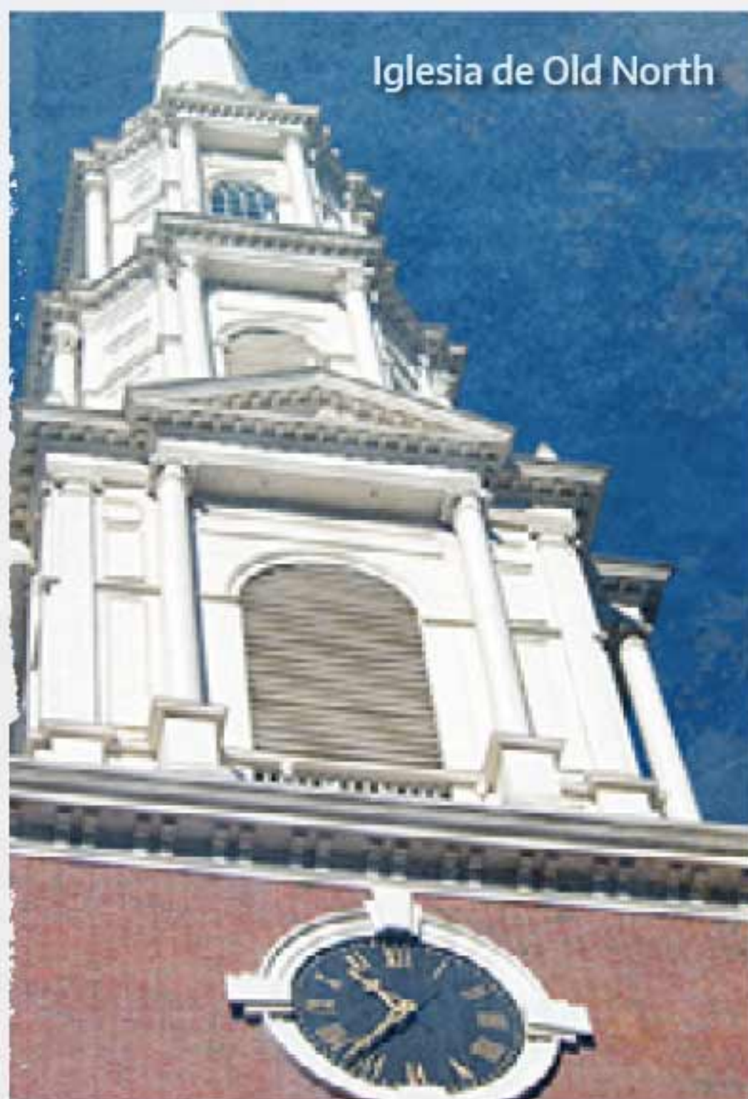
Iglesia de Old North

A continuación ofrecemos una pequeña muestra de las muchas atracciones y cosas que se pueden hacer en Boston: