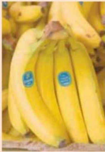
Chiquita pasará a ser una subsidiaria de las brasileñas.

Se espera que el acuerdo se cierre a fines de año o a principios de 2015.