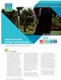
المياه لتحقيق الأمن الغذائي والتغذية (2015)