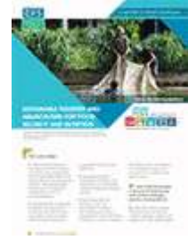
مصايد الأسماك وتربية الأحياء المائية المستدامة لتحقيق الأمن الغذائي والتغذية (2014)