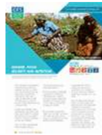
المساواة بين الجنسين، والأمن الغذائي والتغذية (2011)