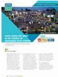
الفاقد والمهدر من الأغذية في سياق النظم الغذائية المستدامة (2014)