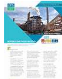
الوقود الحيوي والأمن الغذائي (2013)