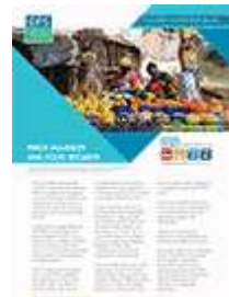
تقلبات الأسعار والأمن الغذائي (2011)