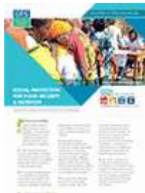
الحماية الاجتماعية لأغراض الأمن الغذائي والتغذية (2012)