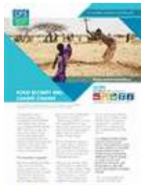
الأمن الغذائي وتغير المناخ (2012)