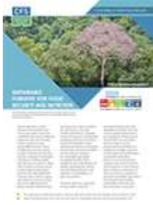
الحرجة المستدامة لتحقيق الأمن الغذائي والتغذية (2017)