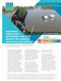
التنمية الزراعية المستدامة لتحقيق الأمن الغذائي والتغذية: أيّ دور للشروة الحيوانية؟ (2016)