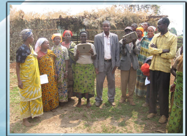
«Fabrication artisanale des blocs à lécher Mélasse-Urée-Calliandra»