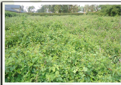
Champ de Desmodium

Pour cela il faut des graminées et des légumineuses en cultures associées ( Brachiaria et Desmodium) ou en pure monoculture (Penissetum purpureum).