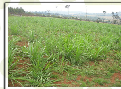
Champ de Penissetum en pure monoculture