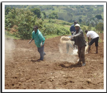
Epandage de la chaux sur un terrain prêt à être ensemencé de légumineuses et graminées fourragères