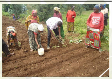
Semis des légumineuses en lignes continues pour une prairie mixte Desmodium -Panicum sur un ex-champ de pomme de terre

Les éclats de souche donnent une reprise rapide. Le Penissetum est une bonne espèce pour l'affouragement à l'auge et à la conservation sous forme d'ensilage. Bien fumé il donne des rendements élevés.