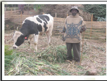
Exploitation des cultures fourragères par le système d'affouragement à l'auge des animaux en stabulation permanente.

Au bout de 3 à 4 ans, la parcelle est livrée à une autre culture et en même temps une autre parcelle va porter les cultures fourragères selon le lotissement préétabli de toute l'exploitation afin avoir à chaque instants des parcelles