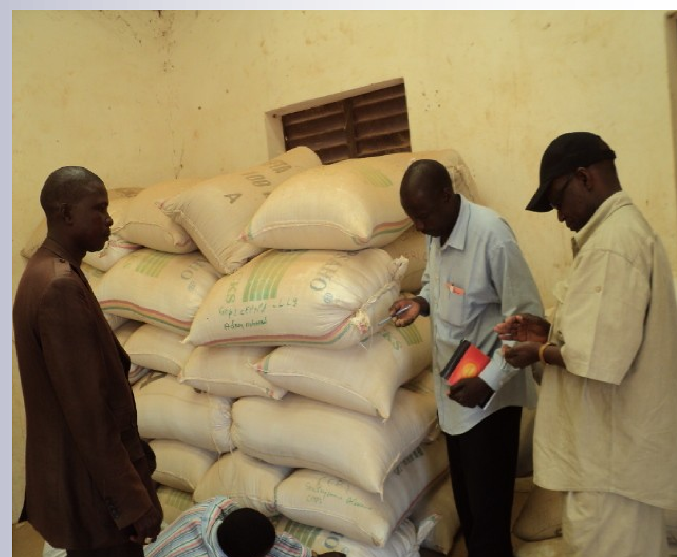
Photo1: vérification de l'état de conservation de semences R1 par la coordination nationale du projet