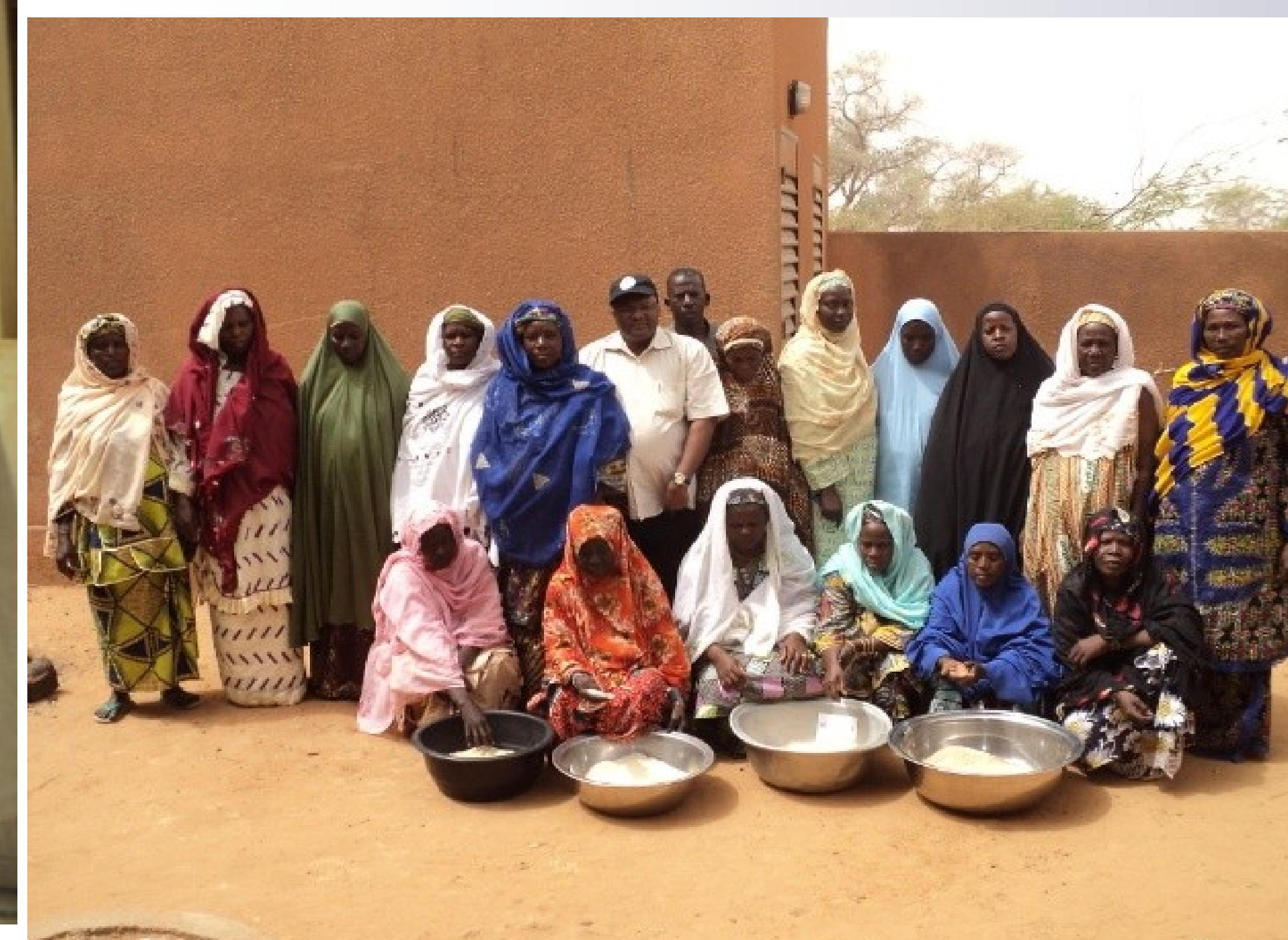
Photo4: Etuveuses de riz après la formation à kollo