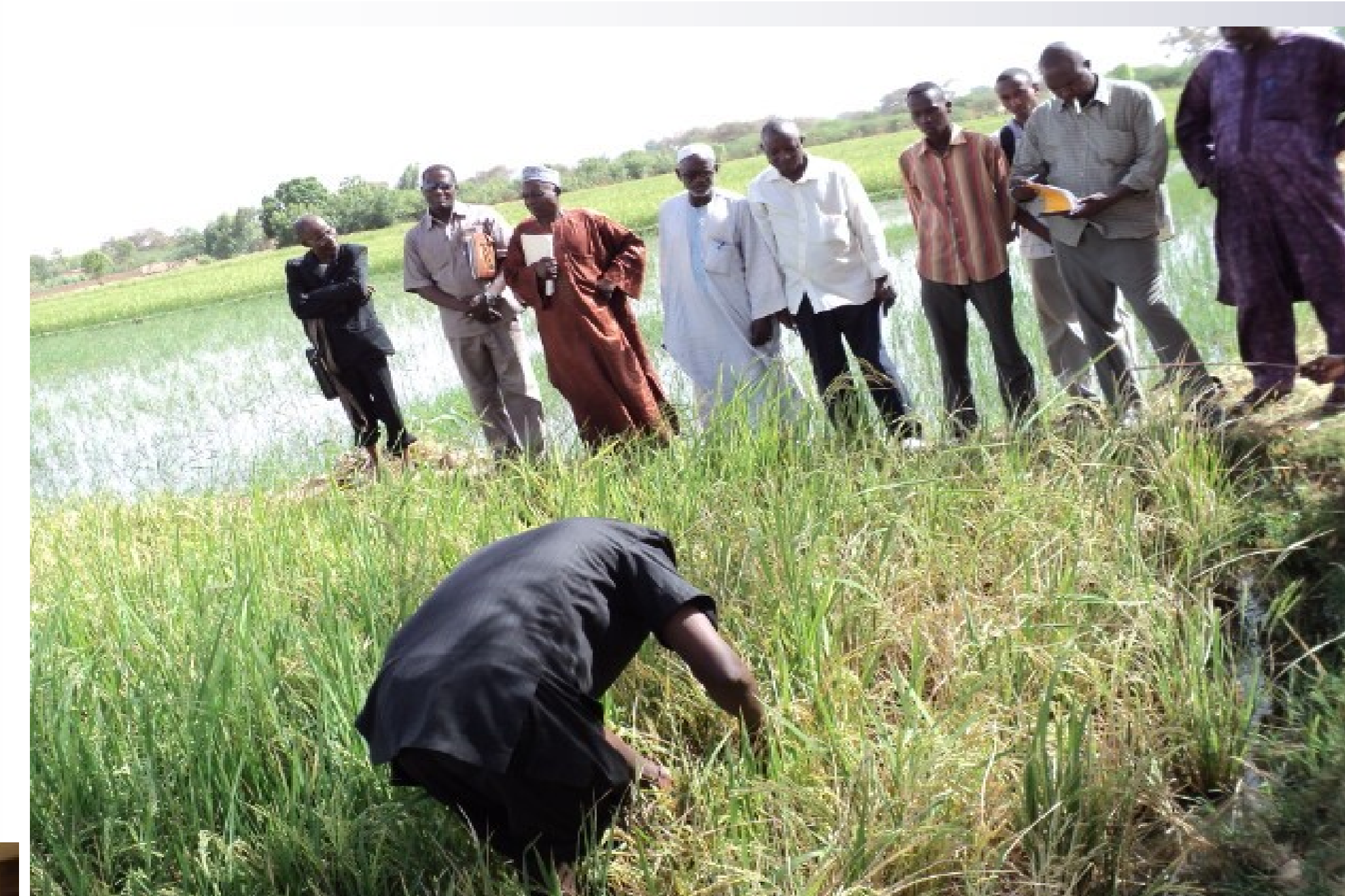
Photo3: Séance pratique des inspecteurs semenciers sur une parcelle à Sébéry