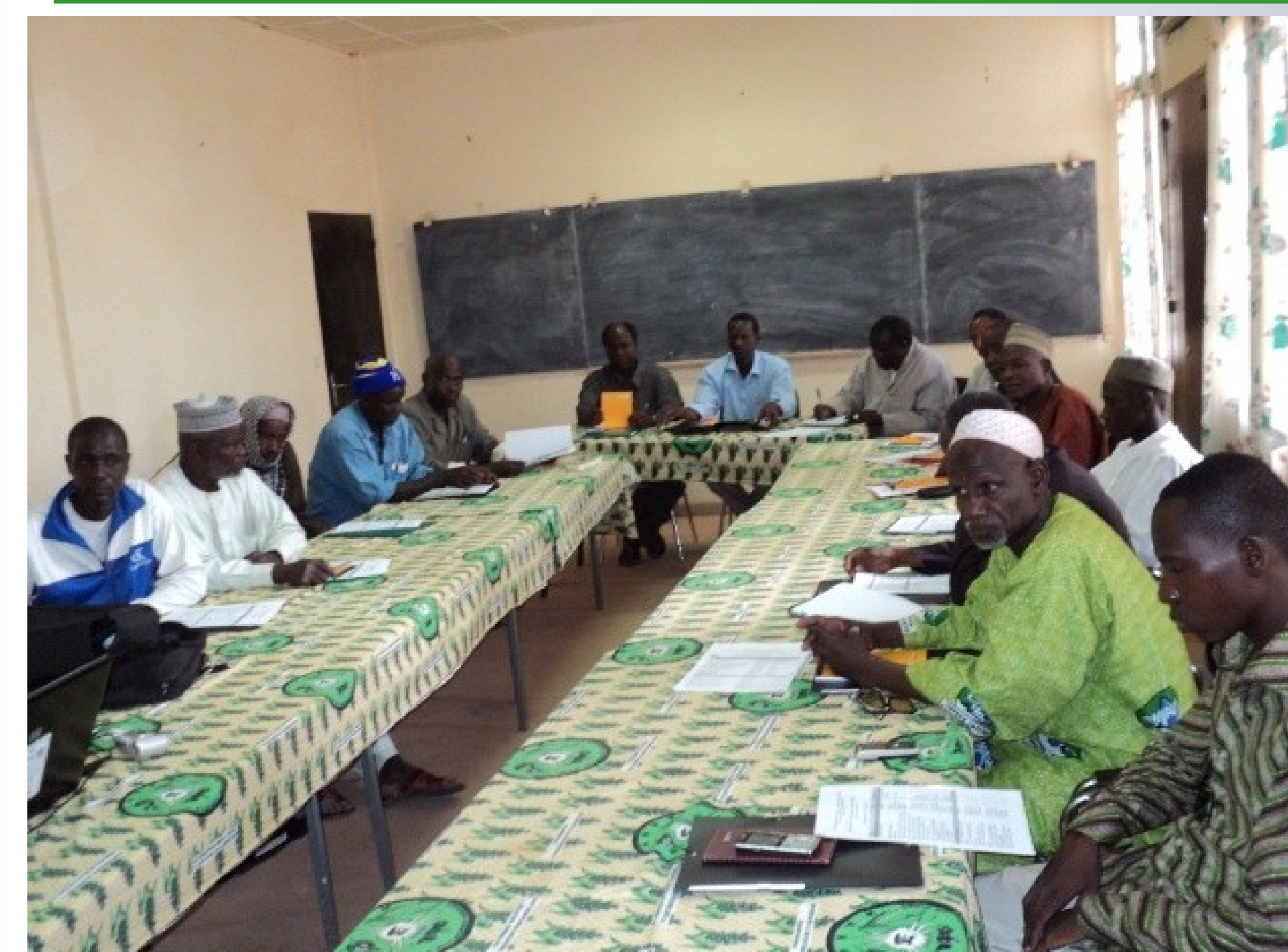
Photo2: Vue des participants à la formation sur la GIR