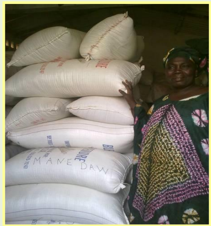
La Présidente des femmes de Bokhol avec des sacs de riz remboursés par les membres de son groupement

Le partenariat développé par le projet APRAO