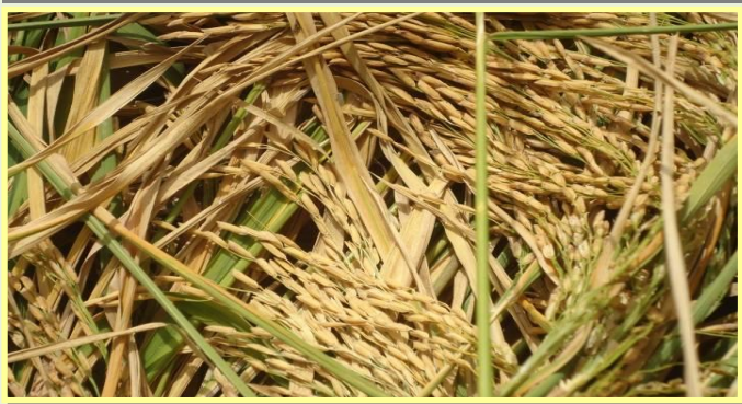
Riz pluvial de plateau en maturité

METHODOLOGIE : La stratégie de mise en œuvre des activités du projet au Sénégal implique tous les partenaires au travers une formalisation par des accords signés. Cette concertation avec les services de l'Etat, les Projets et programmes, les ONG et les Organisations de producteurs a permis d'identifier et de planifier les activités; de développer une synergie dans la mise en œuvre et une mutualisation des ressources. La promotion de la constitution de fonds de roulement à partir des intrants reçus du projet et une formation appropriée pour leur gestion contribuent à pérenniser les acquis du projet au niveau des communautés.