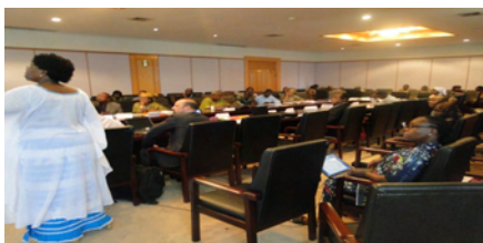
Photo Atelier de Validation VIH/SIDA à Bangui

Cet atelier a été organisé par l'UNICEF sur la validation des directives sur le VIH/SIDA. L'objectif de l'atelier était de réduire le fossé existant entre les gens qui travaillent dans le domaine du VIH/SIDA et ceux des autres secteurs. Il était aussi question de discuter des attentes des participants par rapport au document de la directive sur le VIH/SIDA ; et de faire en sorte que 10% ou plus de personnes qui n'ont pas accès aux médicaments (antirétroviraux), puissent l'avoir, en inscrivant des projets dans le CAP. A la fin de l'atelier, les participants devront être capables de comprendre que les personnes qui vivent avec le VIH et les familles touchées par le SIDA, seront d'autant plus vulnérables pendant une situation d'urgence parce que les mécanismes de résilience seront amoindris et qu'elles auront des besoins spécifiques. Ils seront aussi familiarisés avec les conditions que les situations d'urgence humanitaires peuvent engendrer, et qui sont susceptibles de favoriser la transmission du VIH ou de placer les femmes, les filles, les garçons et des hommes dans une situation particulièrement à risque