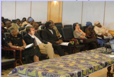
Atelier de Validation SDSRSA

Avec l'appui technique et financier de la FAO, le Ministère du Développement Rural et de l'Agriculture (MDRA) a organisé, le 09 février 2011 dans la salle de Conférence du Stade 20000 places à Bangui, l'atelier de validation du document de Stratégies de développement rural et de la sécurité alimentaire (SDRSA). La cérémonie d'ouverture était placée sous l'autorité de son Excellence, Monsieur Fidèle GOUANDJIKA , Ministre du Développement Rural et de l'Agriculture, assisté par Monsieur le Coordonnateur du Système des Nations Unies en Centrafrique et de Madame la Représentante de la FAO en République Centrafricaine. Etaient également présents, Mesdames les Représentantes du PAM, de l'UNICEF et du HCR, Monsieur le Conseiller Technique du Ministre d'Etat au Plan, à l'Economie et à la Coopération Internationale.