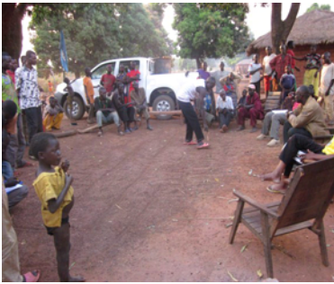
Equipe du Projet lors des études base à Bossangoa, Décembre 2010

Dans le cadre de l'appui de la FAO à la mise en œuvre de la politique du Gouvernement centrafricain exprimé dans le DSRP au Pilier 3 relatif à la réduction de la pauvreté par une diversification de l'économie nationale à travers une meilleure valorisation des ressources naturelles, depuis Janvier 2010 le Projet GCP/RAF/441/GER a démarré ses activités.