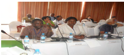
L'ATELIER REGIONAL DU RIZ ET L'AQUACULTURE à

La RCA fait partie du CARD (Coalition Alliance for Rice and développement) groupe 2 qui sont: (République Centrafricaine, République Démocratique du Congo, Ethiopie, Burundi, Tchad, Malawi). Cette rencontre devrait permettre à ces pays de faire l'état des lieux de leur SNDR (Stratégie Nationale du Développement de la Riziculture) et SNDA (Stratégie Nationale du Développement aquaculture) La RCA est avancé dans cette stratégie en produisant le draft 1 qui pourra être soumis pour validation lors d'un atelier national à ce titre. Les pays de l'ANASE (Association des Nations de l'Asie du Sud Est) et le JAPON prêts pour impulser et doubler les productions rizicoles en Afrique Subsaharienne d'ici 2018 à plus de 50 millions de tonnes pour garantir la sécurité Alimentaire.