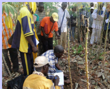
Les maladies et techniques de bouturages du manioc

Le manioc, aliment de base de la population centrafricaine subit depuis plus d'une décennie, des effets néfastes des maladies et ravageurs tels que : -La mosaïque africaine du manioc; La striure brune; L'antracnose; La cochenille farineuse;- Les acariens verts et les criquets puants