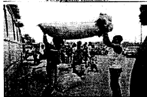
Transport de sacs gnetum