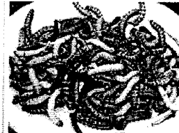
C. n. d. s. ramassés