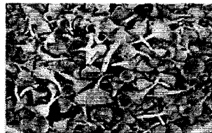
Chêne plantureux ramassés

Retenons que 21 communications ont été présentées par les participants identifiés en fonction des thématiques et des centres d'intérêts développés par leurs structures d'origine respectives. Trois (3) groupes de travail ont été mis en place qui ont hardiment travaillé avec l'appui des facilitateurs du Secrétariat exécutif de la COMIFAC et de la FAO, pour pondre un travail exceptionnel et un ensemble de recommandations formulées notamment au RIFFEAC, aux pays, à la CO-