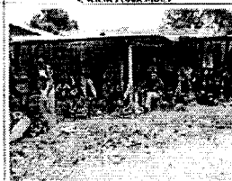
Marché de gnetum

MIFAC, aux partenaires du développement et institutions de recherches.