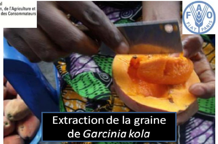
Extraction de la graine de Garcinia kola