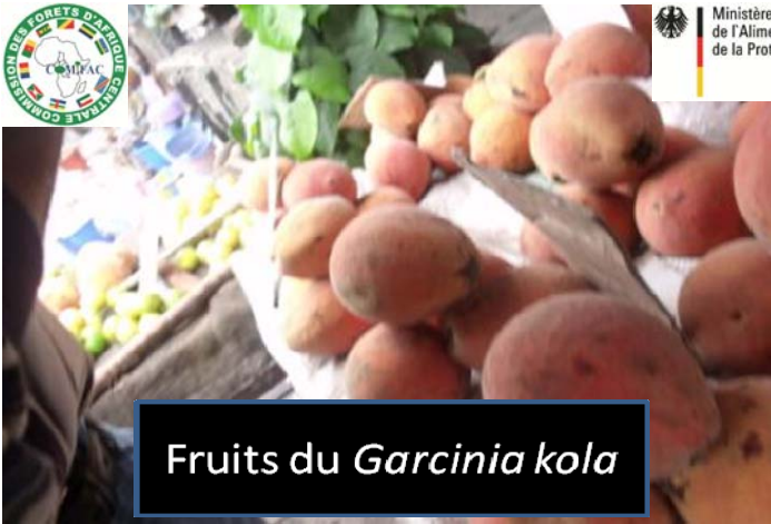
Fruits du Garcinia kola