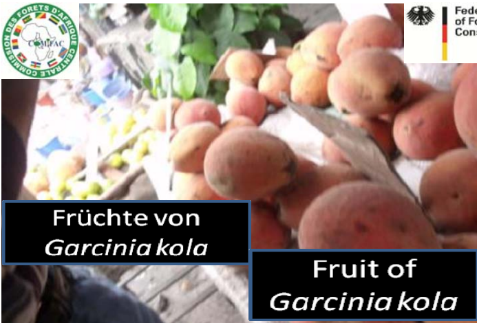
Früchte von Garcinia kola