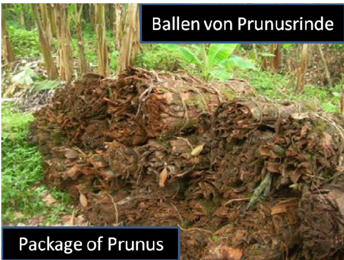
Ballen von Prunusrinde