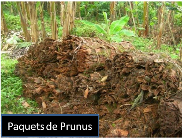
Paquets de Prunus