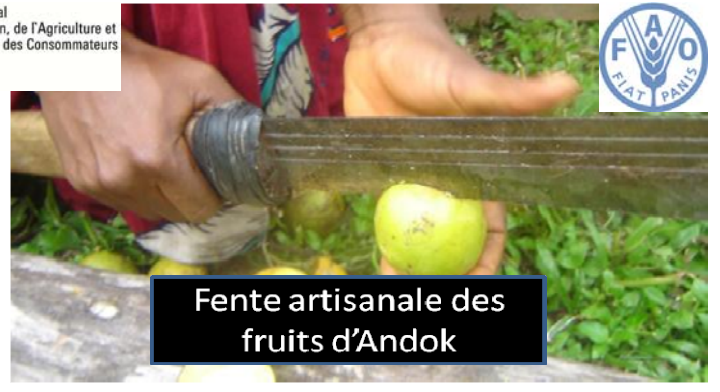
Fente artisanale des fruits d'Andok