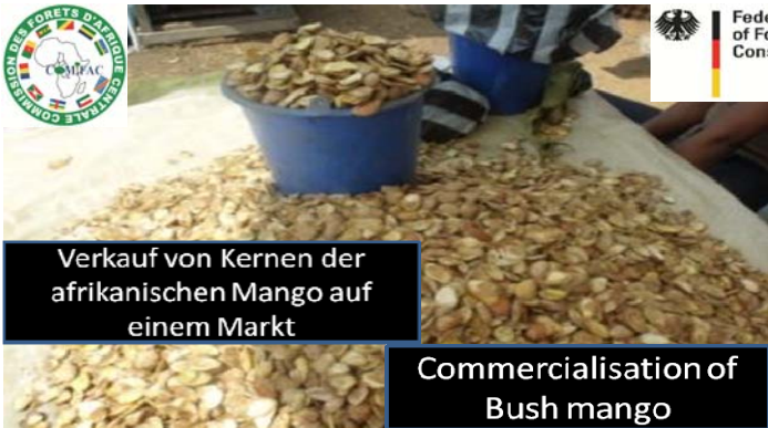
Verkauf von Kernen der afrikanischen Mango auf einem Markt