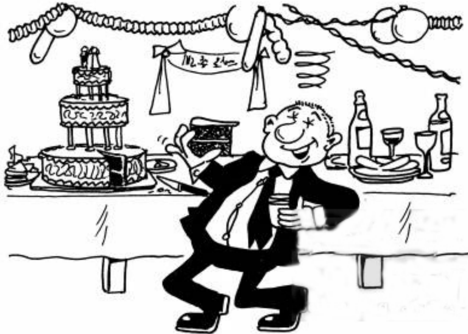
The gate crasher!